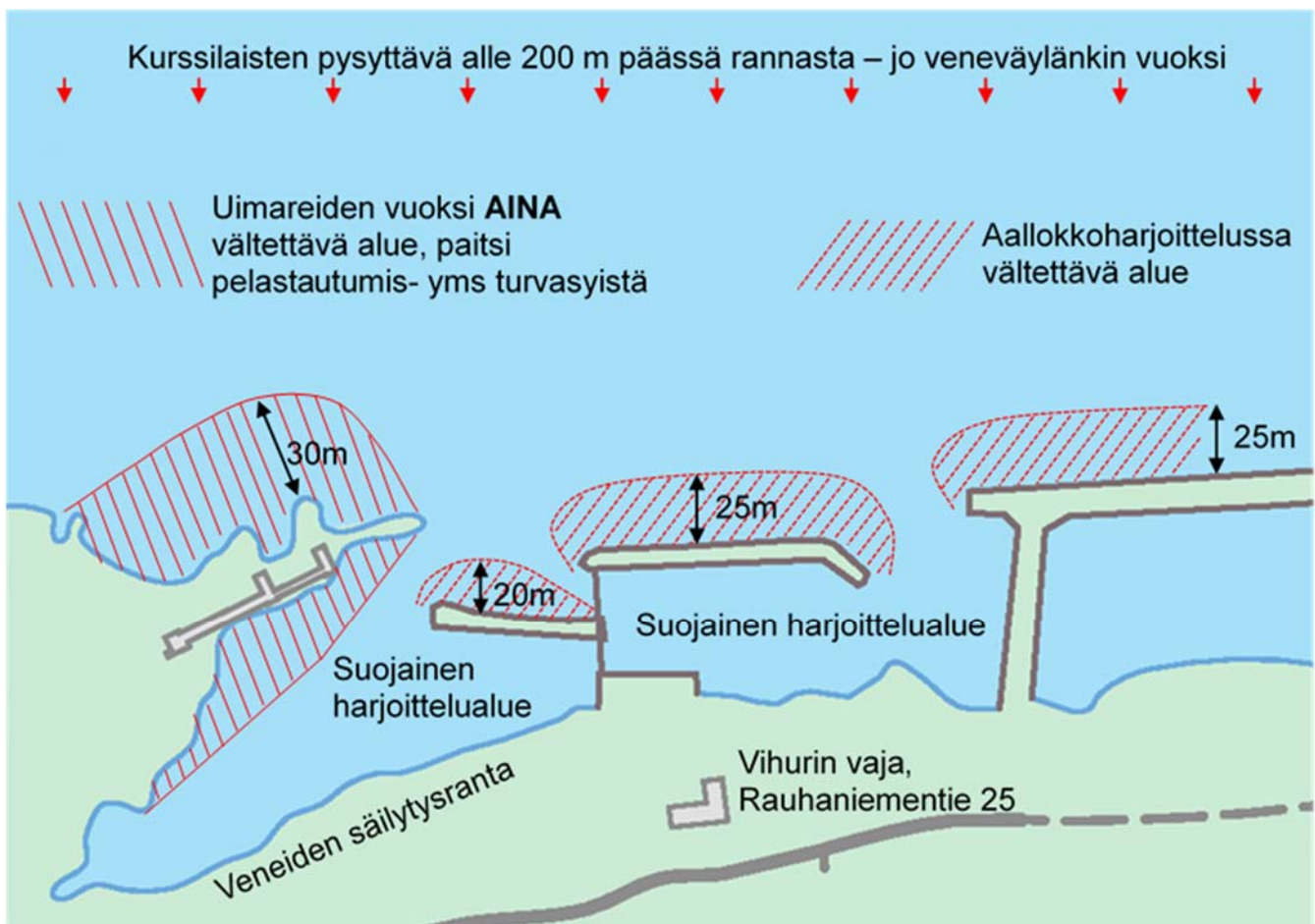
Kuva 2 Melonta-alueet Vihurin vajan läheisyydessä. Jos retki satama-alueen ulkopuolelle estyy tuulen tai ukkosriskin vuoksi, vaihtoehtoinen aallokkoharjoittelu on tehtävä riittävän kaukana rantalouhikoista.