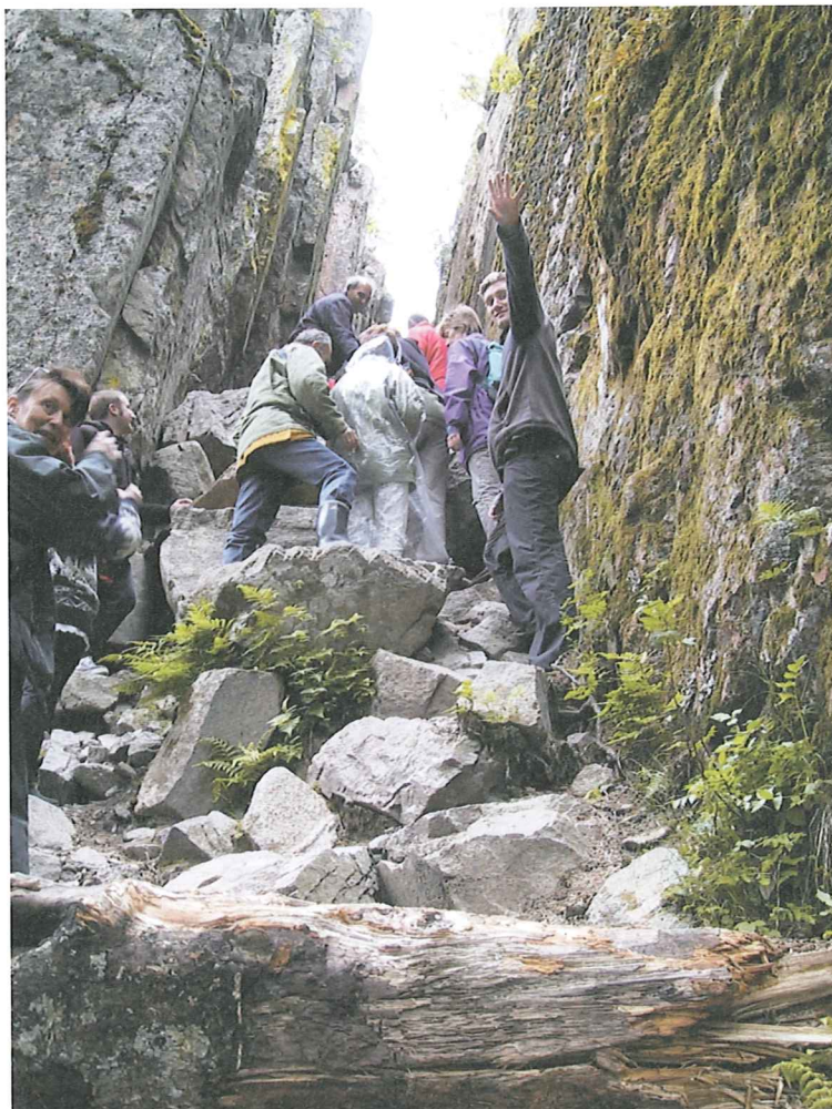
Kuva: Helvetinkolu, Ruovesi

Ruovesi; kioski Helvetinkolun parkkipaikalla kesäisin, keskustan taajaman palvelut.